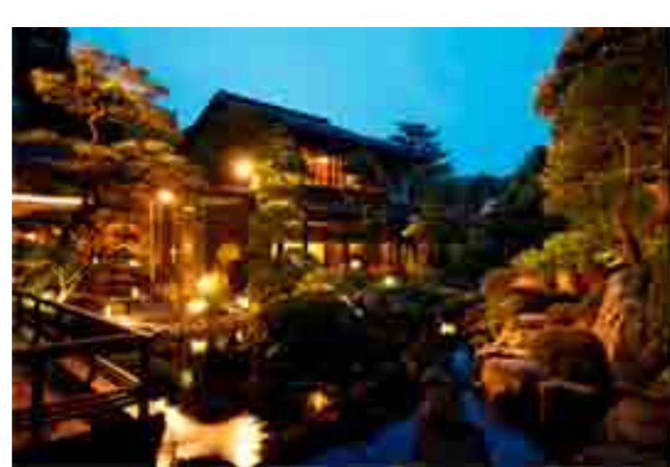
名湯旅館「佳翠苑 皆美」