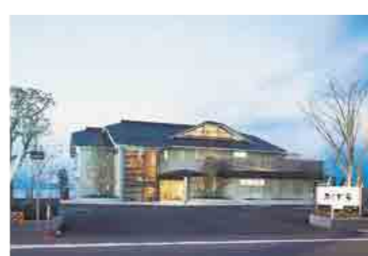
家伝の味を守り伝える「ふじな亭」